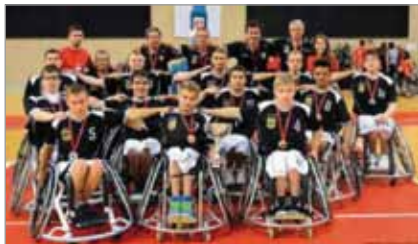
Das Rbb-Juniorenteam holte EM-Silber.