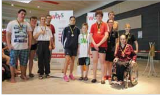
Das Schwimm-Team des WBRs.