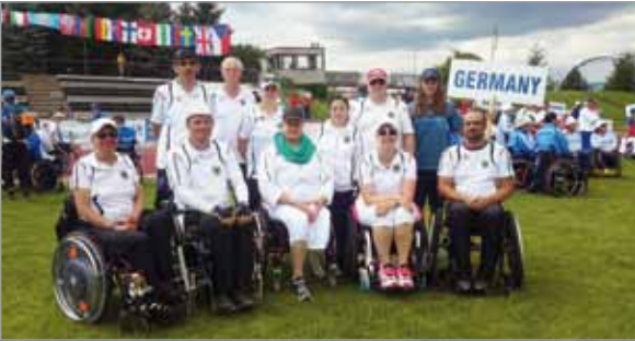
Die WBRS-Schützen auf EM-Kurs