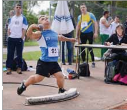
Niko Kappel bei den Süddeutschen Meisterschaften in Weinstadt.