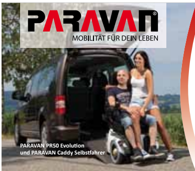
PARAVAN PRSO Evolution und PARAVAN Caddy Selbstfahrer